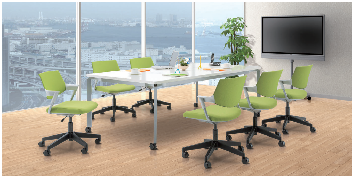
セット写真のチェア MCY-29KF-LM(ライトグリーン)、テーブル OYTN